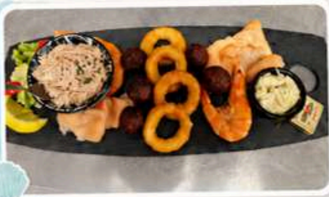
Planche de la mer